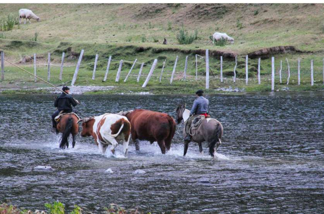
Arreo de Bueyes, alrededores de Coyhaique